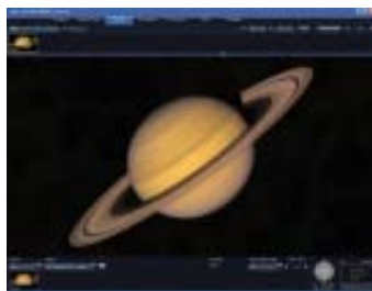
Gambar 1 Worldwide Telescope

Gambar dan tabel harus diletakkan sedekat mungkin dengan teks yang berhubungan. Hindari penggunaan gambar dan tabel berwarna, karena jurnal akan dicetak hitam-putih. File gambar harus disertakan dalam format.gif, .jpg, .bmp, .png, .psd, atau .ai. Semua gambar dan tabel harus disertai keterangan dan nomor gambar atau tabel.